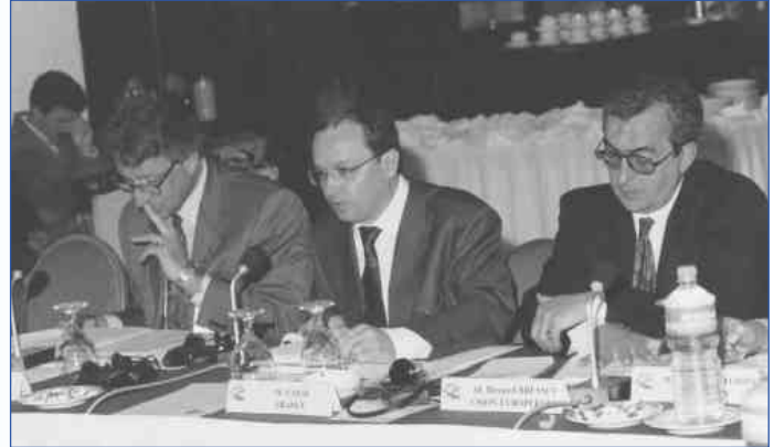
Reunión del grupo de trabajo SEMISA Amán, 8-9 de abril de 1997

La Conferencia de Marsella ha puesto en evidencia la necesidad de un conocimiento lo más profundo posible de las herramientas, los actores y los métodos de gestión del agua. La información disponible sobre estos temas sólo existe de forma fragmentaria, dispersa y heterogénea. Es por lo tanto necesario emprender un esfuerzo de racionalización y legibilidad para hacer que la misma sea fácilmente accesible y utilizable.