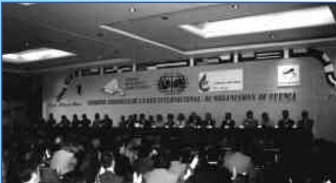
La Asamblea General en Morelia